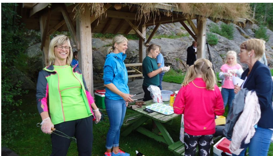
Godt humør på standen til Sisu 4H.