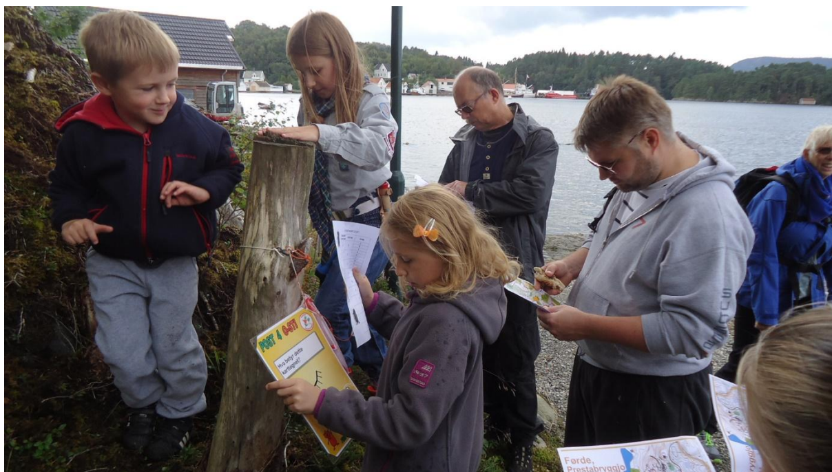
Ihuga deltakarar under årets Finn-Fram-dag.