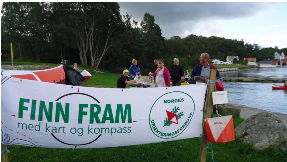
Start og mål for rundløypa under Finn Fram dagen på Strando.