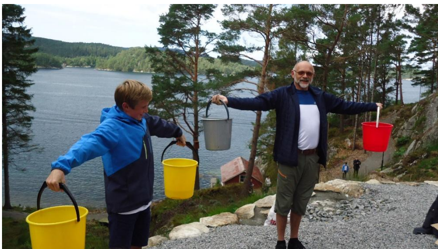
Valestrand søndagsskule ville kåra søndagens sterkaste pappa.