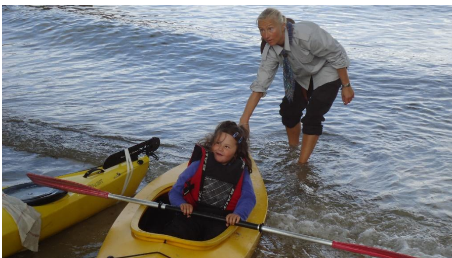
Førde-speidarane og Bua-speidarane kunne tilby m.a. kanopadling på sin stand.