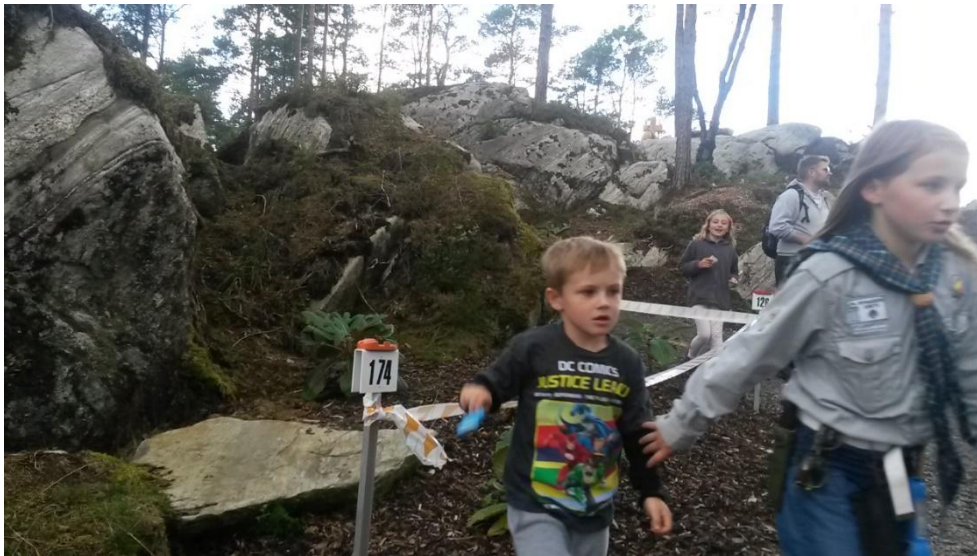
Speed-orientering i regi av SOL samla 50 deltakarar.