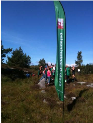
Den nye klubbfaaa på haustens kaffipost

Blant gjestene på haustens kaffipost blei det trekt ut tre premiar.